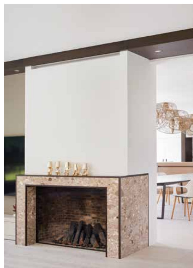
"Het was wel even puzzelen, maar uiteindelijk is het gelukt om de woning in z'n geheel licht en luchtiger te maken"