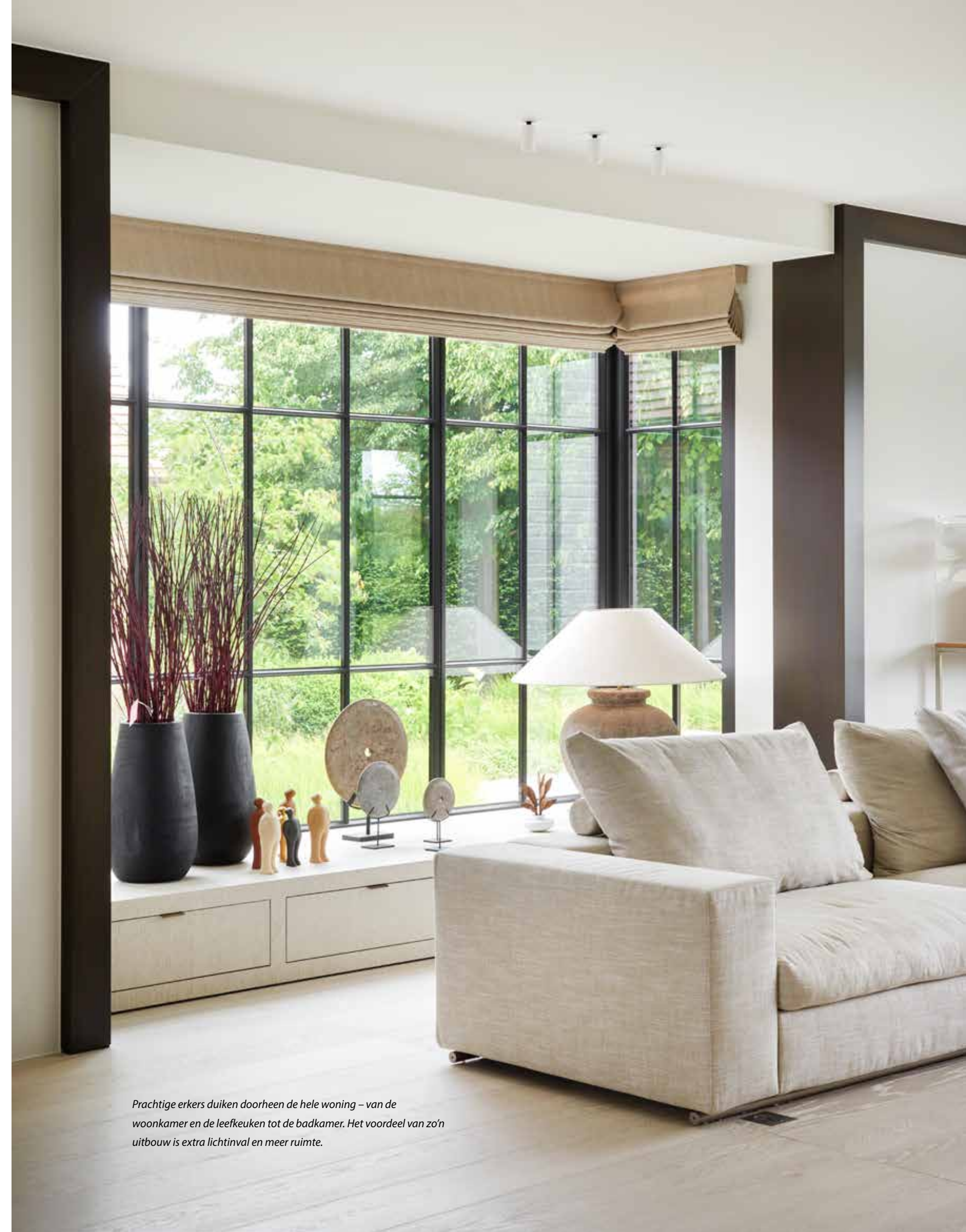
Prachtige erkers duiken doorheen de hele woning – van de woonkamer en de leefkeuken tot de badkamer. Het voordeel van zo'n uitbouw is extra lichtinval en meer ruimte.