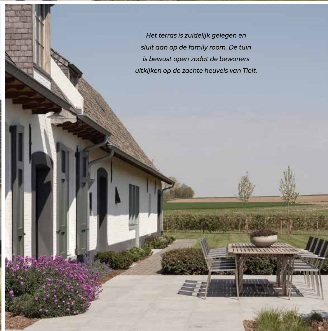
Het terras is zuidelijk gelegen en sluit aan op de family room. De tuin is bewust open zodat de bewoners uitkijken op de zachte heuvels van Tiel.