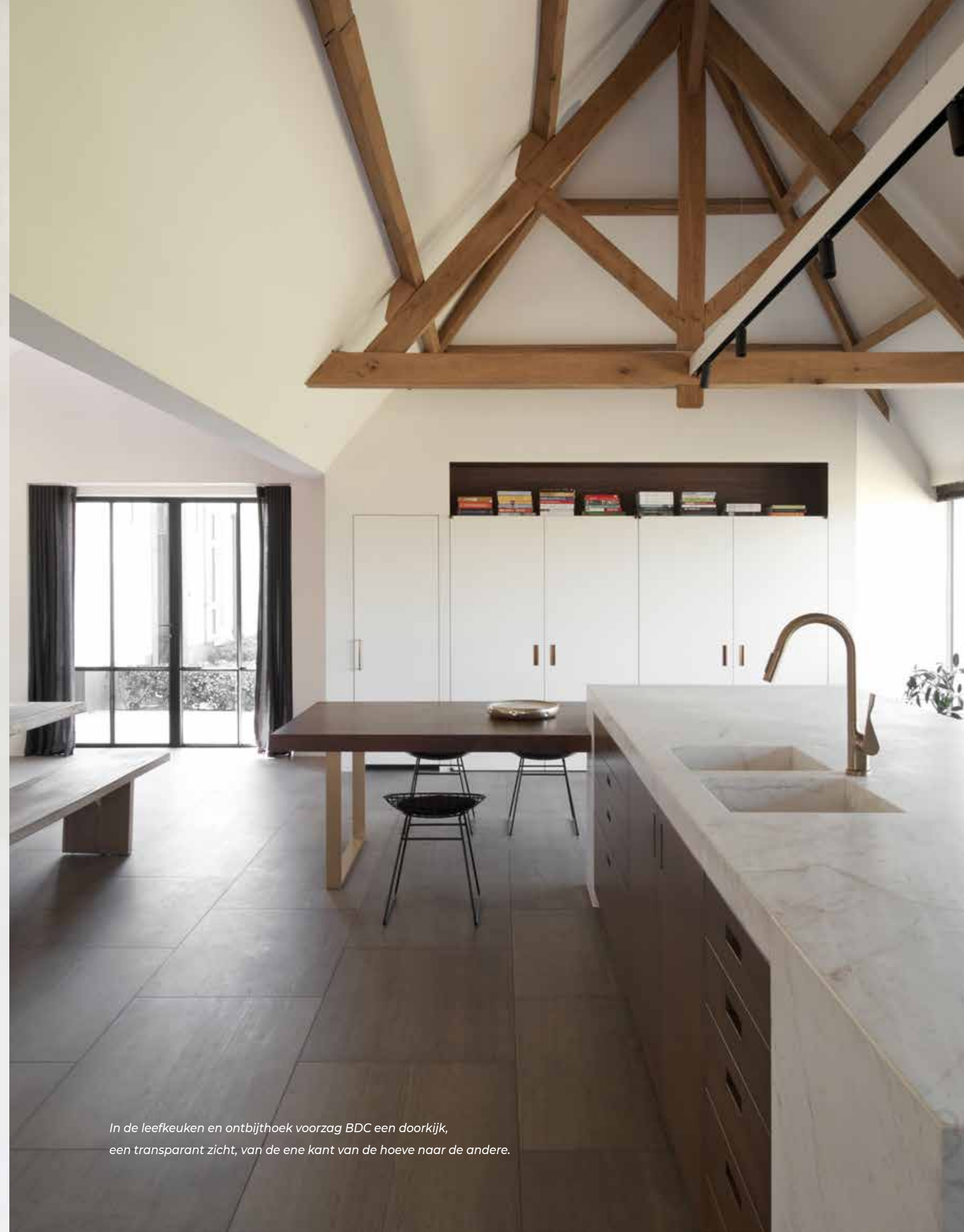
In de leefkeuken en ontbijthoek voorzag BDC een doorkijk, een transparant zicht, van de ene kant van de hoeve naar de andere.