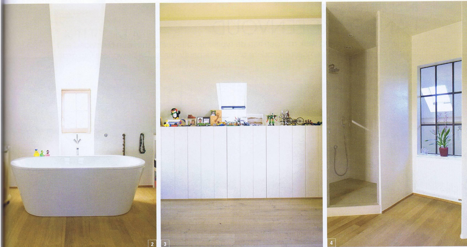
1. Op de zolder werd een valse wand met extra opbergruimte en een televisietoestel rond de oude schoorsteen gebouwd. Achter deze muur is de toegang tot de badkamer van de ouders. 2. Ook op zolder vind je doordachte perspectieven terug via buiten- en binnenramen. Zo kijk je vanuit het bad (een ontwerp van Philippe Starck) via een klein raam richting dorpskerk. 3. In de kinderkamer werd voor voldoende opbergruimte gezorgd. De kast werd op maat gemaakt (Obumex). 4. De badkamer heeft aan de achterzijde een binnenraam met zicht op de hal beneden. Via een dakraam stroomt rechtstreeks daglicht binnen.

een hoek, je hebt toch een prachtig uitzicht in alle richtingen. Met als pièce de résistance een enorm boograam dat tot op de grond reikt zonder zichtbaar raamkader en met een schilderachtige kijk op het onmetelijke Meetjesland. Ook in de oostelijke en westelijke gevel werden grote vensters geïnstalleerd die tevens toegang verlenen tot de tuin. Dankzij een glazen binnendeur is er een diagonaal zicht op de rest van het erf. Via de andere binnendeuren is er vanuit de keuken zicht op enerzijds de gang in het hoofdvolume en anderzijds de aanpalende eetkamer.