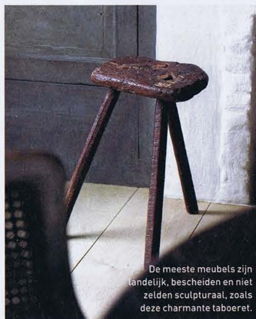
De meeste meubels zijn landelijk, bescheiden en niet zelden sculpturaal, zoals deze charmante taboeret.

In tegenstelling tot de inrichting van zijn vroegere woning, die meer afgestemd was op de classicistische stijl van het herenhuis, werd het decor hier een stuk vrijer ingevuld met enkele moderne accenten, zoals de zwarte tv-kamer, hedendaagse kunst en hier en daar vintage design. Het oorspronkelijke woonhuis werd verbonden met de schuur, waardoor de binnentuin beschermd wordt tegen de wind. Tussen schuur en woning ligt de grote keuken met een open raam op het landschap. In de schuur zijn enkele werkruimtes ondergebracht. Ook daar bleven alle oude constructie-elementen bewaard, tot en met de ijzeren steunbalken. De meeste wanden zijn roodgalkalk en het meubilair is er uitgesproken landelijk. Achter de schuur ontdek je een zwembad met een terras vol oude stenen, omrand door een parterre vol bloemen.