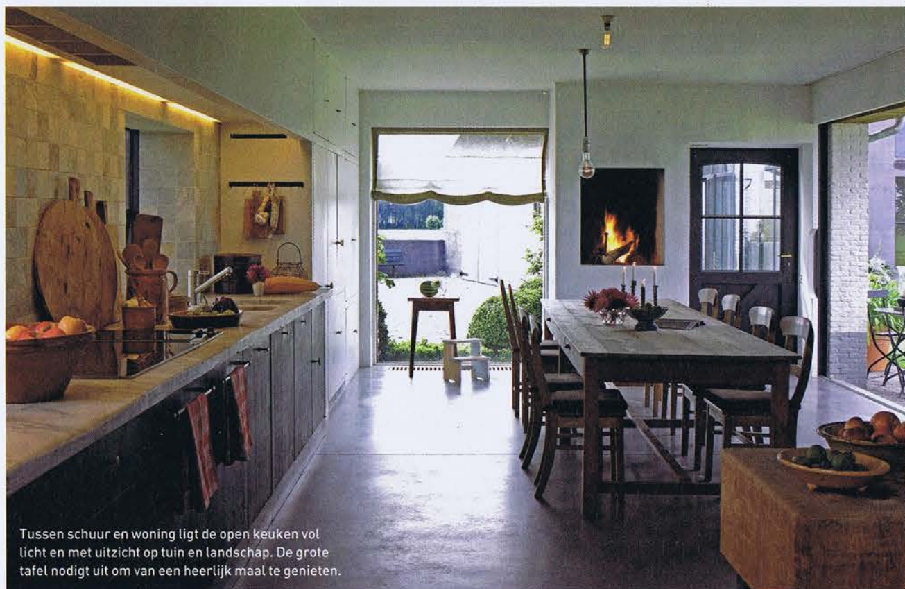
Tussen schuur en woning ligt de open keuken vol licht en met uitzicht op tuin en landschap. De grote tafel nodigt uit om van een heerlijk maal te genieten.

het interieur bleef grotendeels bewaard, met inbegrip van de oude schouw in de eetkamer en vrijwel alle balklagen. „Aan de indeling van het oude huis heb ik weinig veranderd”, zegt de architect, „omdat ik die kleine kamertjes wilde behouden. Als alle deuren openstaan, ontstaat er wel een grote woonruimte. De oude deuren, waarvan zelfs de beschildering bewaard bleef, doen dan dienst als een kamerscherm. Als ze dicht zijn, versterken ze de intimiteit.”