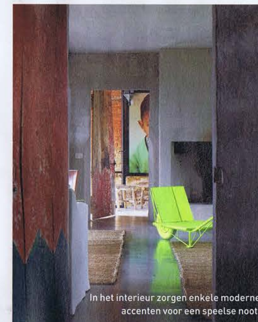
In het interieur zorgen enkele moderne accenten voor een speelse noot.

Over architect Bernard De Clerck verscheen bij uitgeverij Beta-Plus een overzichtswerk: 'Architectural Stories' (89,50 euro).