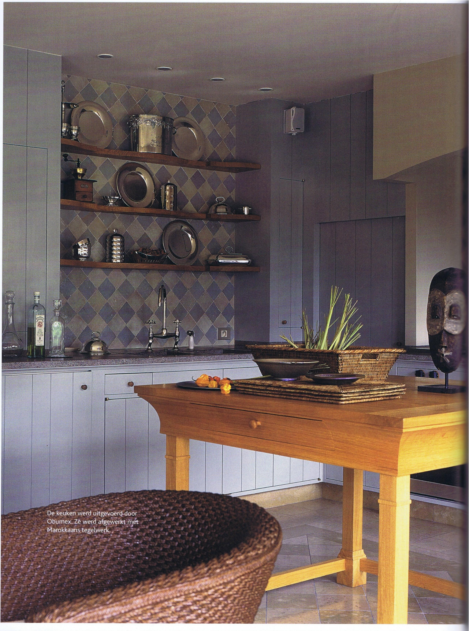
De keuken werd uitgevoerd door Obumex. Ze werd afgewerkt met Marokkaans tegelwerk.