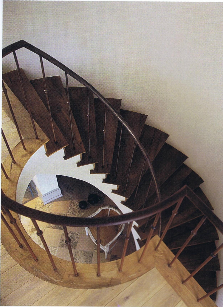
Foto onder: De badkamer is een ontwerp van Bernard De Clerck. Als basismateriaal werd een combinatie van witsteen en geschilderd eiken gebruikt.

woning, maar dan soberder van karakter. De combinatie van gebogen plafonds en de meer rechte 'standaardplafonds' geeft ook een mooie afwisseling tussen de verschillende ruimten. Je legt creëert contrasten tussen de verschillende kamers en dat komt de beleving en de sfeer ten goede. Een wandeling door het huis zal nooit hetzelfde zijn."