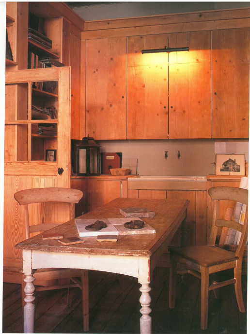
LINKERPAGINA EN LINKS Twee perspectieven op de stalenkamer met kitchenette voor de mede werkers.

De persoonlijke relatie met de opdrachtgever is van het allergegrootste belang, en die wordt het beste opgebouwd vanuit een informele, huiselijke omgeving.