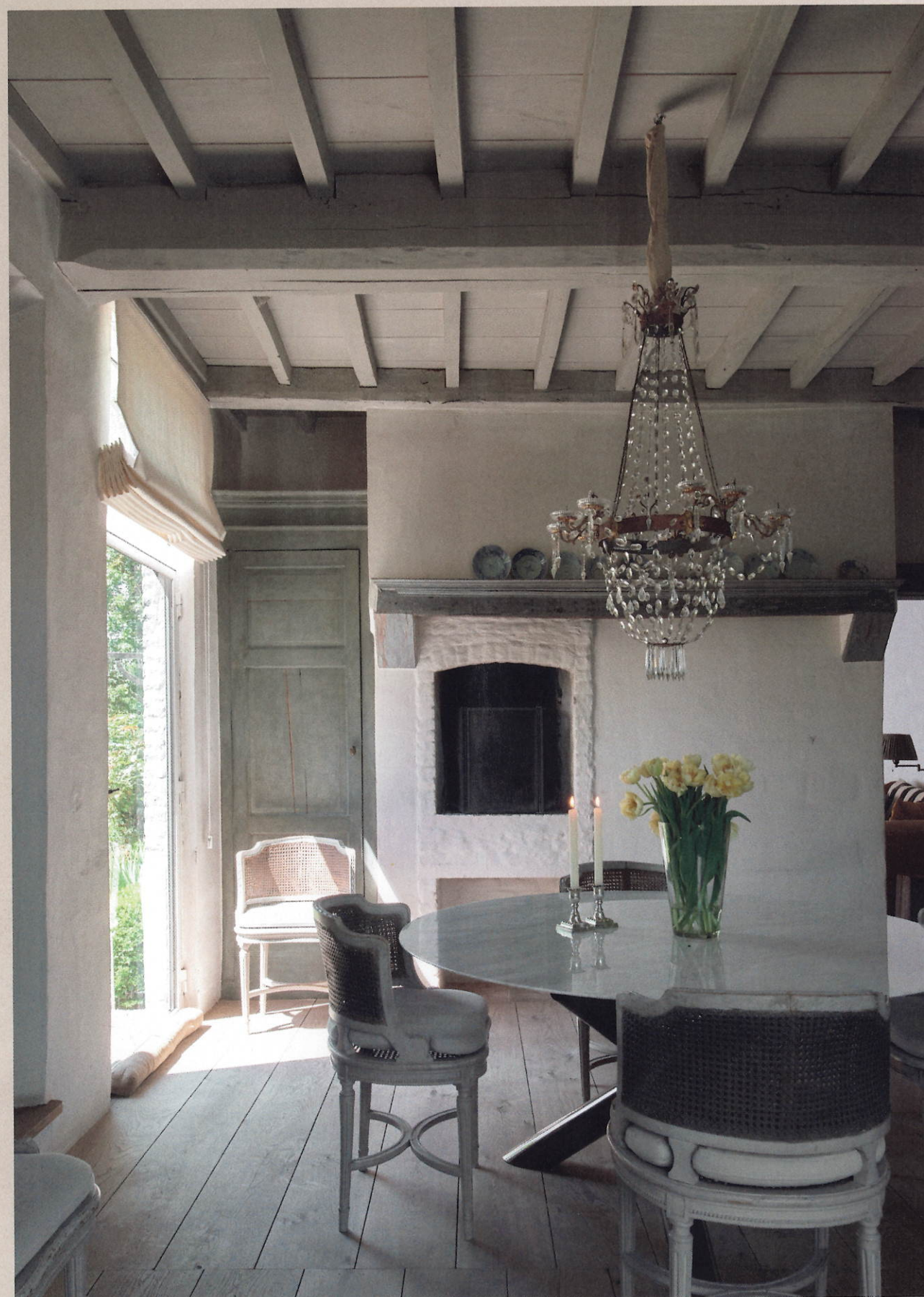
Vanaf de zithoek loop je naar de eetkamer waar zich de andere kant van de schouw openbaart. Aan de ronde tafel van Molteni staan 19e-eeuwse stoelen; erboven hangt een Italiaanse kerkluchter.

Het marmeren blad werd gerecupereerd van traptreden; de wandtegels zijn overschotjes van oude marmer.